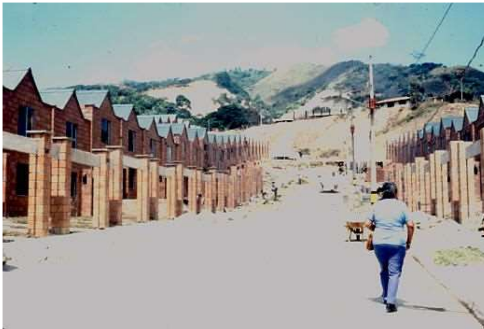
Figura 5. Construcción de Vivienda nueva en la periferia